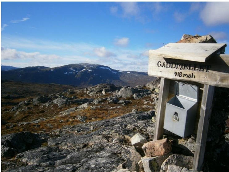
Rindal IL har gjennom turstigruppa tilrettelagt for mange turmål.

Rindal IL har i dag over 800 medlemmer og har avdelinger for fotball, ski, håndball, friidrett og tursti. Det er stor aktivitet for barn, unge og voksne i alle aldersgrupper både sommer og vinter. På sommeren dominerer fotball og friidrett, på vinteren ski og håndball. På vinteren sørger idrettslaget for oppkjøring av skiløyper og på sommeren er det et mangfold av turstier som er merket og tilrettelagt for folk flest. Det er også idrettslaget som har tilrettelagt stien rundt Igeltjønna og som har ansvar for vedlikehold av denne.