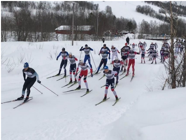
I skigruppa er det stor deltakelse både blant yngre og opp til seniornivå..

Det er ingen som har plikt til å stille opp på dugnad eller komitéarbeid for idrettslaget, men hvis ingen stiller opp blir det liten eller ingen aktivitet. «Vippser» du deg ut av dugnaden er det til slutt ingen som treffes for å ta et tak sammen og kjenner på gleden ved å løfte i flokk. Vi er overbevist om at vi får et bedre miljø (både innad i laget og i bygda vår) hvis du setter av tid og bidrar med positivitet i lag med andre.