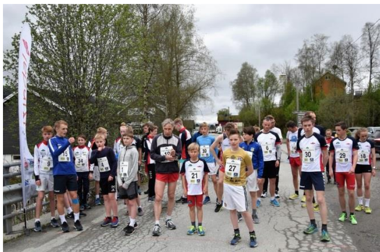
Friddrett er populært blant store og små.

Rindal IL ønsker seg så mange medlemmer som mulig. Ønsker du selv å bli medlem eller kjenner du noen som kan tenke seg å bli medlem, gi oss beskjed om dette (epost til post@rindalil.no ). Kanskje vi kan nå 1000 medlemmer i løpet av året? Da får vi tilnærmet 50% av bygdas befolkning som medlemmer. Dette hadde vært stort!!