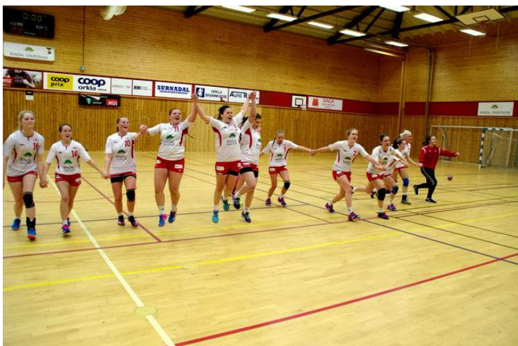
Håndballaget rykket i år opp til 3. divisjon og får nye utfordringer.

Det er ingen som har plikt til å stille opp på dugnad eller komitéarbeid for idrettslaget, men hvis ingen stiller opp blir det liten eller ingen aktivitet. «Vippser» du deg ut av dugnaden er det til slutt ingen som treffes for å ta et tak sammen og kjenner på gleden ved å løfte i flokk. Vi er overbevist om at vi får et bedre miljø (både innad i laget og i bygda vår) hvis du setter av tid og bidrar med positivitet i lag med andre.